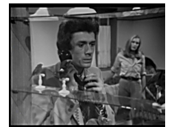
Un mystère contemporain

Cette dramatique qui s'appuie sur des événements réels se déroule en 1970 à et au zoo d'Ozoir-la-Ferrière. Derrière Peter Springel (personnage fictif) se cachent plusieurs "voyants" dont l'auteur a voulu faire la synthèse. Le héros de cette mystérieuse histoire s'occupe de deux énigmes à la fois, selon son inspiration. L'une a trait au kidnapping d'un enfant ; l'autre concerne une mort jugée suspecte.