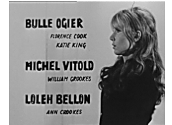
Un esprit nommé Katie King

l'histoire se situe en 1875 à Londres et raconte comment un savant notoire et respecté a entrepris une série d'observations et d'expériences sur un curieux "médiu", Florence Cook. Celle-ci était une très jeune fille qui était la matérialisation de Katie King, une prostituée du XVIIe siècle. Ce savant veut trouver la cause rationnelle de phénomènes dits surnaturels. Est-il en présence d'une mythomane, d'une névrosée ? Ne risque-t-il pas dans cette aventure de perdre sa réputation et sa raison ?