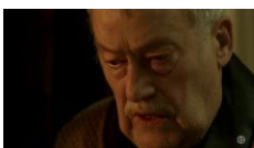
La Tête dans le sac