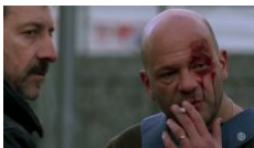
La Ligne jaune