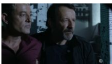
Entre la Terre et l'Enfer

L'épisode, aux couleurs du téléphoné, se referme alors que Walter vient d'abattre le fils du Turc