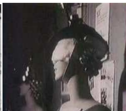
Mannequin l'Exposition Internationale du Surréalisme 1938

« Magritte estimait que mes romans étaient poétiques par certains côtés Et c'est à ce moment là que j'ai cessé d'écrire des poèmes Il semble que la veine poétique est passée insensiblement dans la prose des romans » Léo Malet