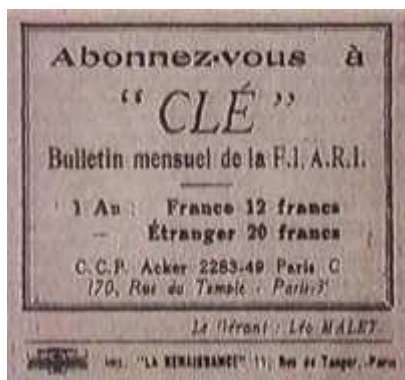
Bulletin Clé N°1

Lors de son passage au POI (parti ouvrier internationaliste), Léo Malet devient gérant du bulletin Clé "organe" de la FIARI, Fédération internationale de l'art révolutionnaire indépendant, fondé par Léon Trotski, André Breton et Diego Rivera