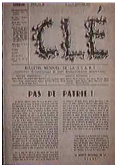
Bulletin Clé N°1

Dans le cadre du groupe des Surréalistes Léo Malet invente le procédé du «décollage», « objet-miroirs », pratique le collage et publie des recueils de poèmes